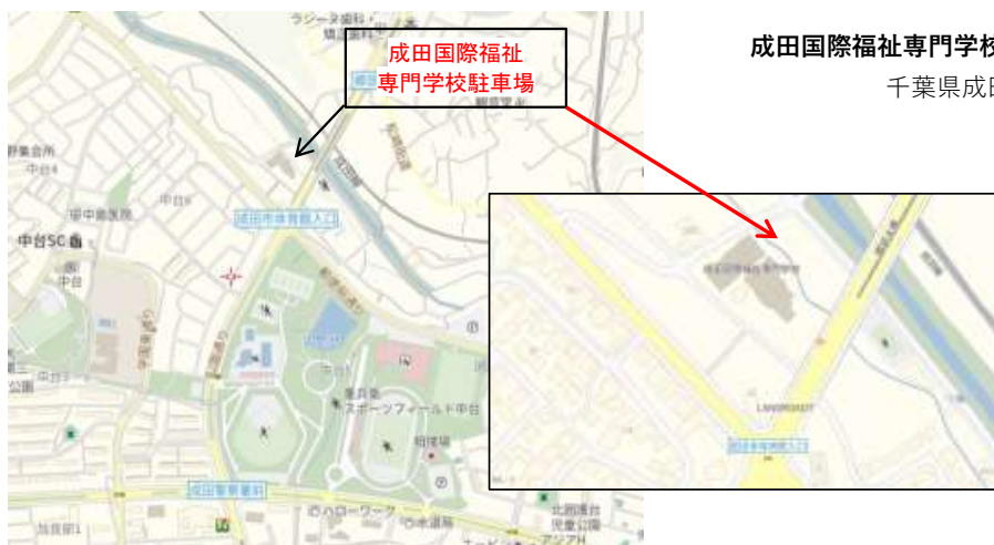
成田国際福祉専門学校 千葉県成田市郷部583-1