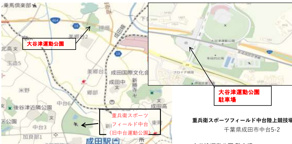
重兵衛スポーツフィールド中台陸上競技場 千葉県成田市中台5-2